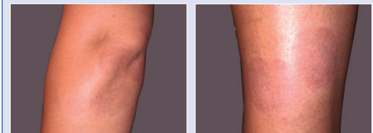
Abbildung 3 und 4: Nach 4 Wochen Kombinationstherapie mit der Excimer-Lampe (10 Behandlungen) und einem Vitamin-D 3 -Analogon.