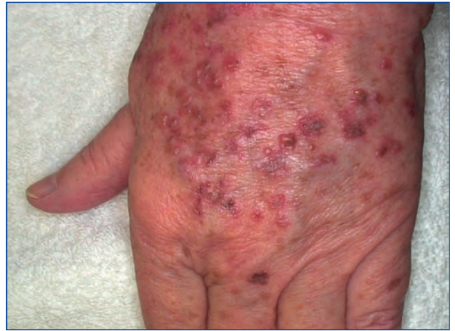
Abbildung 8: Blasenbildung am Tag 2 nach Behandlung diverser Lentiginos solares auf dem Handrücken mit q-switched NeoDym YAG 532nm Laser.