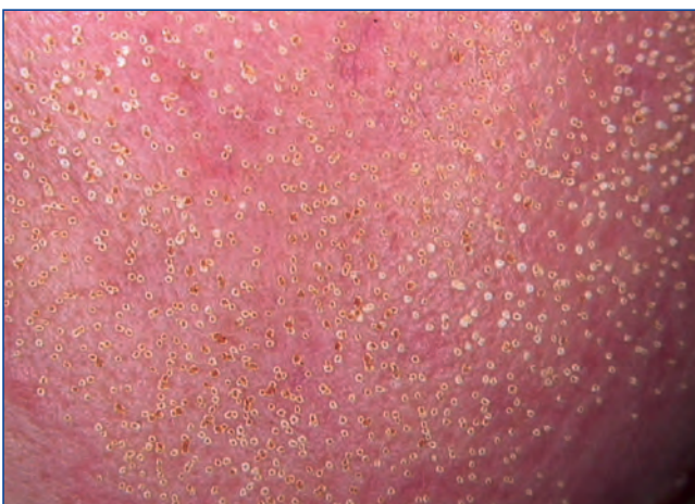
Abbildung 1: 1 Minute nach ablativem CO 2 Fractional-Laser.

Bei einer ablativen fraktionierten Lasertherapie mit einem CO 2 - oder Erbium-Laser entstehen gezielt Mikrotraumata. Die Haut wird in unterschiedlichem Ausmass fraktioniert eröffnet ( Abbildungen 1 und 2 ).