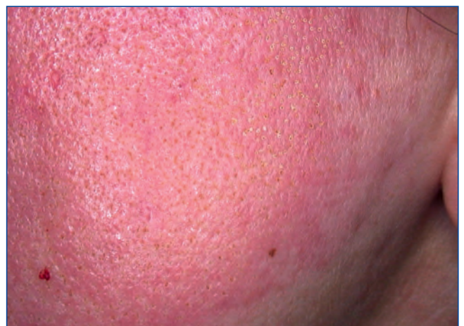
Abbildung 2: 10 Minuten nach ablativem CO 2 Fractional-Laser: Rötung und Blutungen setzen ein.