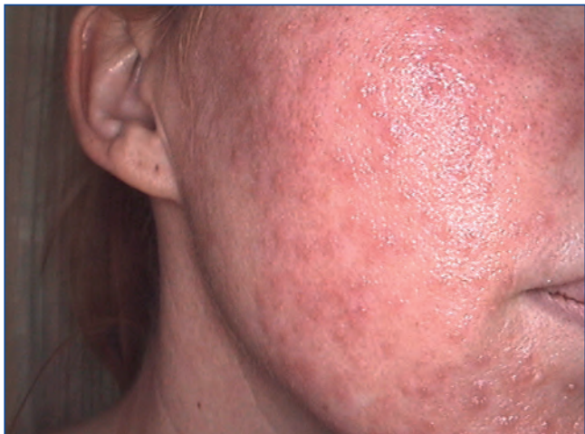
Abbildung 3: Überfettungspusteln durch maskenartige Creme-anwendung nach CO 2 Fractional-Laser.