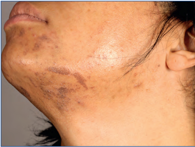
Abbildung 7: Hyperpigmentierung nach Epilationslaser.