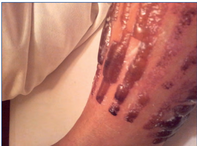
Abbildung 5: Blasenbildung nach IPL-Behandlung.