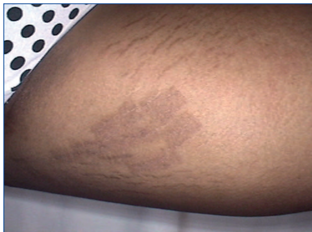
Abbildung 6: Postinflammatorische Hyperpigmentierung nach Probelaserbehandlung mit CO 2 Fractional-Laser wegen Striae distensae.

Direkt nach der Behandlung kann sowohl nach einer ablativen als auch nach einer nicht ablativen Laserbehandlung ein Thermalwasserspray, beispielsweise von Avène oder La Roche-Posay, verwendet werden. Thermalwasser hemmt Irritationen, wirkt abschwellend und ist wundheilungsfördernd. Für den Patienten ist es angenehm kühlend. In Sprühdosen abgefüllt ist es bakteriologisch rein und reinigt damit sanft und sicher. Eine Okklusion ist strikt zu vermeiden – sowohl durch Verbände als auch durch okklusive Externa. Die Folge wären Wundinfektionen oder Überfettungspusteln (Abbildung 3).