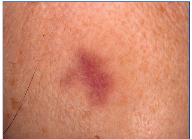
Abbildung 10: Detailansicht mit protrahierter Rötung und beginnender Hyperpigmentierung.

cortisonhaltigen Lotionen oder Cremes sinnvoll machen kann. Bei Überdosierung der Epilationslaser kann es besonders bei dunkleren Hauttypen zu stärkeren Reaktionen bis hin zu Blasenbildung kommen (Abbildung 5). Hieraus resultieren mögliche Hyper- und gegebenenfalls sogar Hypopigmentierungen (Abbildungen 6 und 7). Die Anamnese zu vorhergehender Sonnenexposition und möglichen photosensibilisierenden Medikamenten ist deshalb besonders wichtig. In Zweifelsfällen empfiehlt sich ein kleines Probelaserareal 48 Stunden vor der Behandlung. Die Nachpflege soll diese möglichen Risiken eindämmen. Konsequenter Sonnenschutz ist besonders im Gesicht ratsam, denn nach dem Laser ist auch vor dem Laser. Direkt nach der Behandlung sollte gekühlt werden, bis ein etwaiges Brennen nachlässt. Im Gesicht dürfen Rötungen mit Make-up, am besten mit Sonnenschutz (beispielsweise mineralische Kompaktsonnencreme 50+ von Avène), abgedeckt werden, ansonsten bietet sich ein ungetöntes, sehr leichtes Präparat wie Anthelios XL LSF50+ fluid® von La