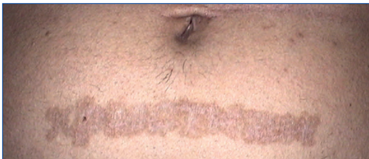
Abbildung 12: Hyperpigmentierung nach Tatttoolaser.