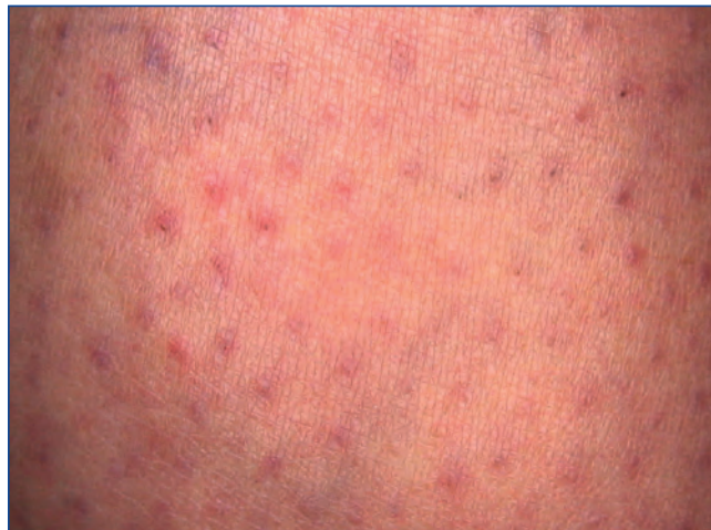
Abbildung 4: Wenige Minuten nach Epilationslaser (hier Alexandrit): Perifollikuläre Rötung und Ödem.