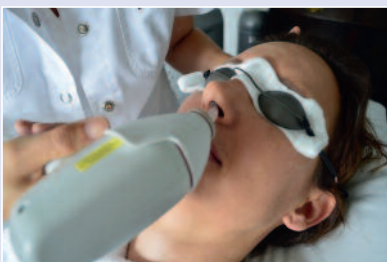
Abbildung 1: Nasenhaarbehandlung mit dem Soprano ICE (Diodenlaser mit Alexandrit-Wellenlänge) mit fokussiertem Gesichtsaufsatz (z.B. für Nase, Ohren, Augenbrauen)

Interessenkonflikte: Die Autorin veranstaltet im Rahmen ihres Engagements für die «Smartaging Swiss Academy – Education in skin laser treatments» mit diversen Laserfirmen Fortbildungsveranstaltungen und Workshops. So auch mit der Firma Alma Lasers. Die komplette Liste ist auf der Homepage www.smartaging-swiss.academy einsehbar.